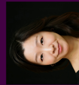
Yoko Yamada Piano

March 28 to April 4, 2025 Villa Sawallisch in Grassau